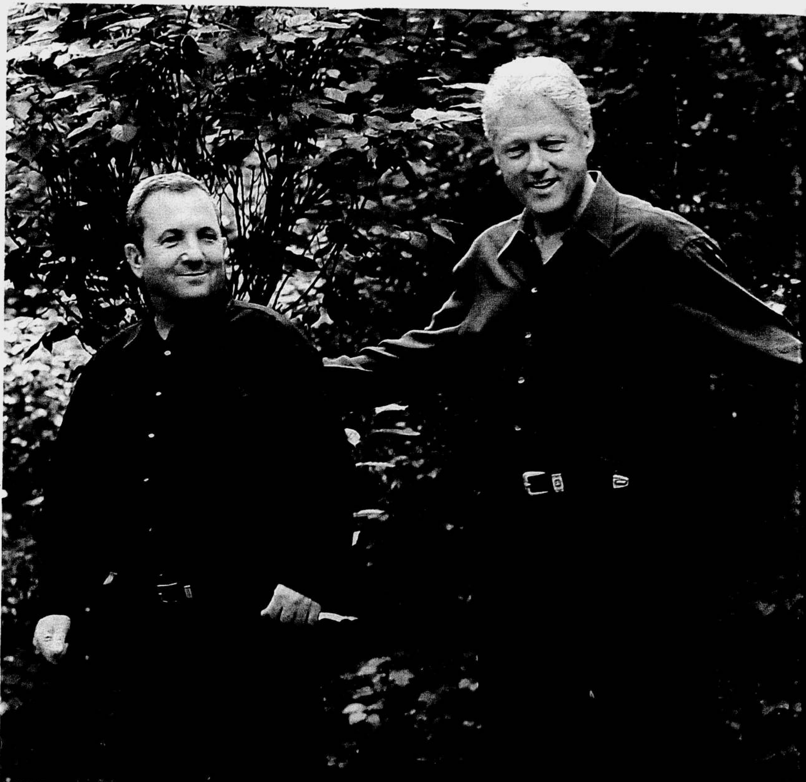
קלינטון מנסה לגשר בין ברק לערפאת, יולי 2000, קמפ דייויד. כאשר העסק דרך במקום יום הנשיא משחק סימולציה שבו עלתה לראשונה הצעה ישראלית בעניין ירושלים צילום: רויטרס

ביחס לכוונות הצד השני. התברר שאוסלו היתה עבור ערפאת איוו הסוואת-ענק שמאחוריה הוא הפעיל ומפעיל לחץ מדיני וטרור במינונים שונים כדי לערער את עצם הרעיון של שתי מדינות לשני עמים". ברא נחזור להתחלה. לשיחות הראשונות שלך עם ברק כשהוא מטיל עליך את משימת המשא ומתן. על איזה סוג של פשרה טריטוריאלית חשב אז? "באחת הפגישות הראשונות הראה לי ברק מפה שכללה את בקעת הירדן והיתה מעין תוכנית אלון מעובה מאוד. הוא התגאה שהמפה שלו משאירה בידי ישראל כשליש מהשטח. אם אינני טועה היא העניקה לפלשתינים 66% בלבד. אהור היה משוכנע שהמפה הגיונית מאין כמותה וניסה לשכנע גם אותי שכל מי שיראה אותה יבין שהיא מבטאת הצעה סבירה לגמרי. שם הוא היה, במחווות ההם. היה בו איזה wishful thinking פטרוני, תסילב, כשאמר לי בהתלהבות תראה, זו מדינה. לכל עניין ודבר זה נראה כמדינה. באותה נקודת זמן לא התווכחתי איתו. לא אמרתי לו לזרוק את המפה לפח או לעשות ממנה טיירה. אבל בהמשך, בעקבות שיחות עם פל-שת'נאים וביוררים פנימיים, הוא הבין שאי אפשר להציג ברבים מפה כזאת". אז עם מה הגעתם אל המשא ומתן? מה היתה העמדה הישראלית הרשמית שגלעד שר ואתה הצגתם לפלשתינאים בשיחות הפוריות בשטוקהולם במאי 2000?