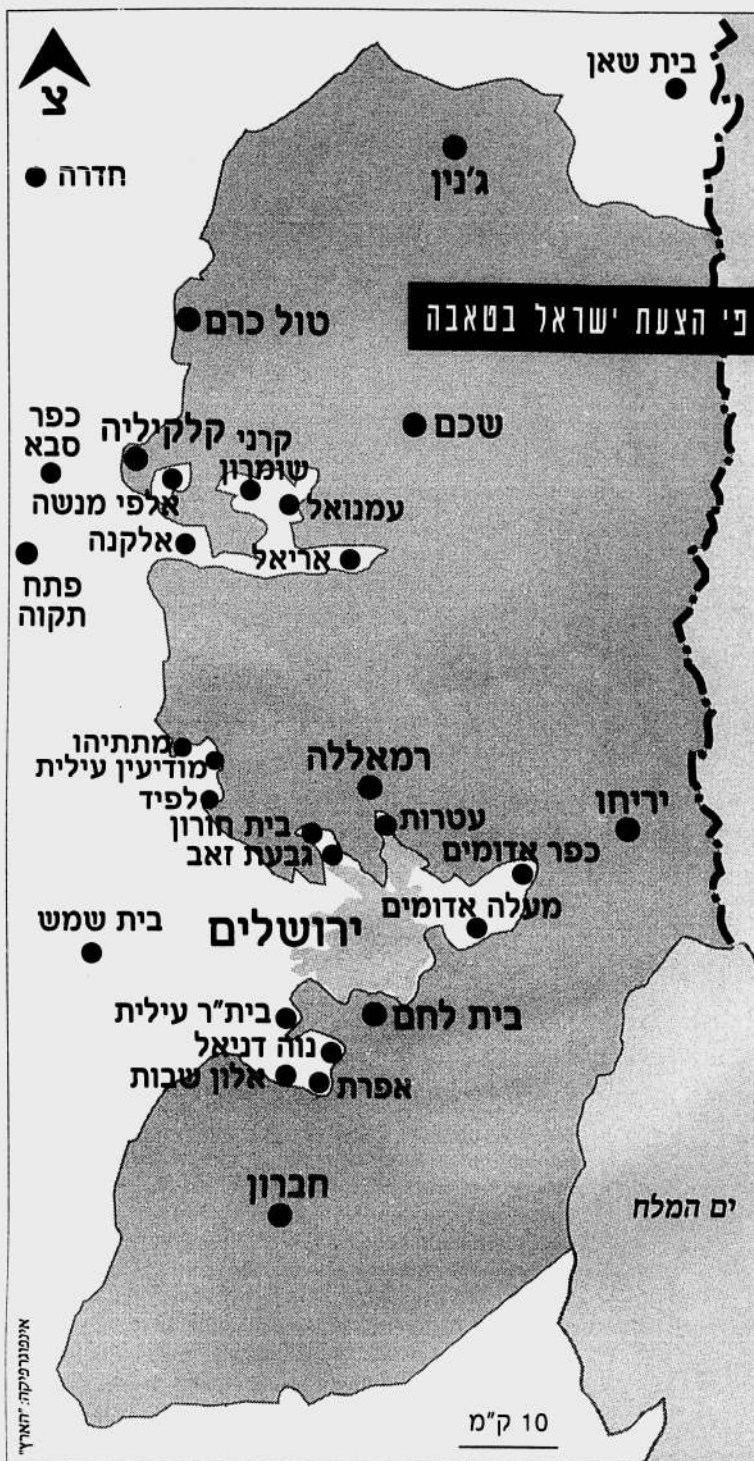
מפה ששורטטה על סמך הוועידה הישראלית בטאבה: מדינה פלשתינית על כמעט 100% מהגדה: שלושה גושי התיישבות, פינוי כמאה התחלופיות, הכל לפני חילופי שטחים

לא התאפקתי והתפרצתי. שאלתי אותם, מי כאן צריך להקים מדינה, אנחנו או אתם. הרגשתי תסכול נורא שהנה, אנחנו עושים מהלך כל כך יצירתי, והם לא יכולים להשתחרר מהניגוח"