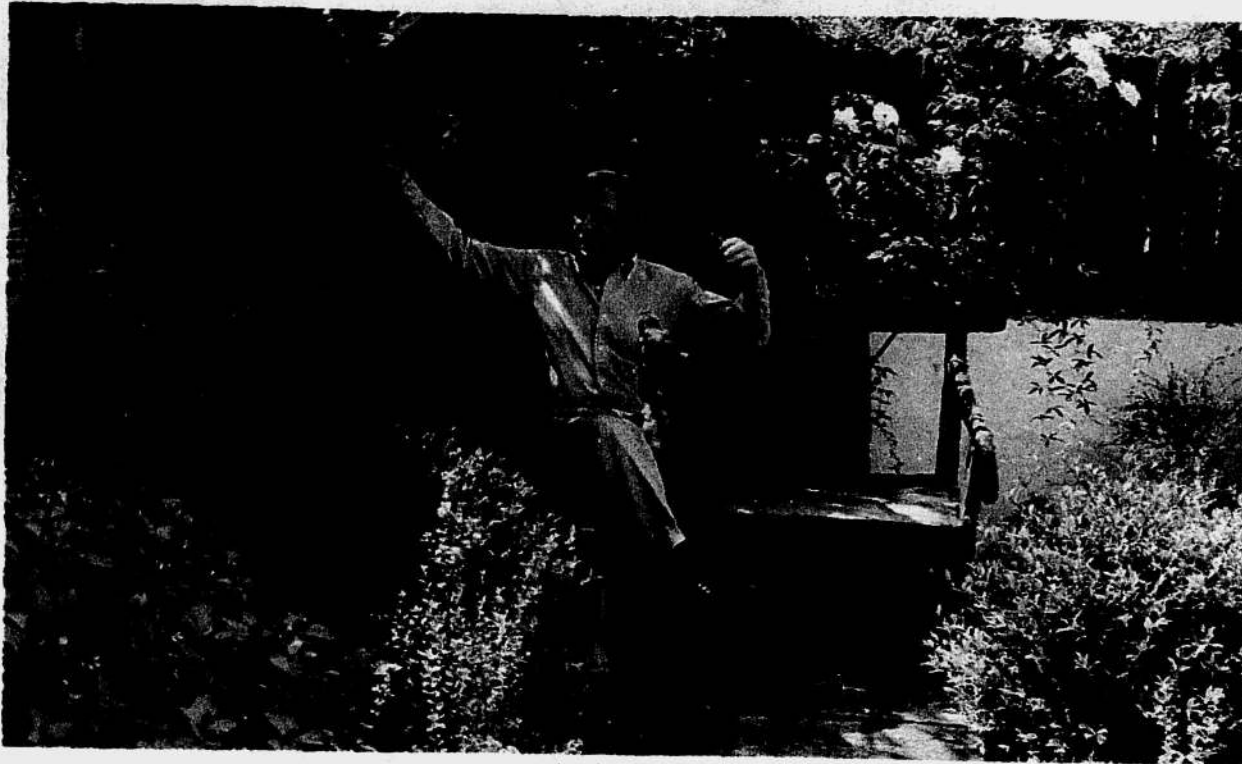
בן עמי בגינת ביתו. לא ראיתי בעיניהם כאב של הזדמנות מוחמצת

בעצם ברק וערפאת לא נפגשו כלל בקמפ דיוויד. לא ממש. היתה ארוחת ערב אחת שאולברייט ערכה כדי להמיס את הקרח. ברק ישב כנציב מלח ולא הוציא מלה. זה היה מביך מאוד"