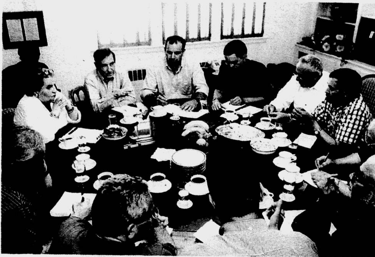
שתי המשלחות בקמפ דייוויד. משמאל ובכיוון השעון: מדלן אולברייט, שלמה בן עמי, גלעד שר, שלמה ינאי, אמנון ליפקין שחק, חסן עספור, אבו עלא, סאיב עריקאת, מוחמד דחלן, ג'מאל חלל, מרטין אינדיק

ב-17 לחודש הלכתי לבקתה של אהוד ופגשתי את קלינטון שבדיוק יצא משם ואמר לי שהמסר של ערפאת הוא נכונות ל-8% מהגדה עם חילופי שטחים סמליים ברצועת עזה