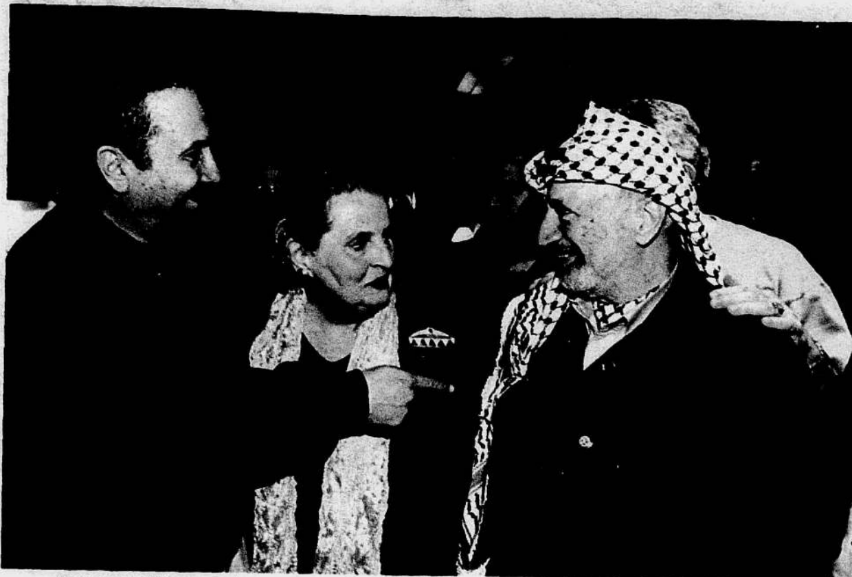
ערפאת, אולברייט וברק בקמפ דייויד. הפגישה היחידה בין השניים היתה בארוחת ערב שהיא יומה בניסיון להמיס את הקרח

יהיה קשה מאוד לאהוד. אחר שהחלטנו להישאר וקלינטון נסע, הוא נכנס ליומיים של התבודדות בבקתה שלו. אף אחד מאיתנו לא ראה אותו. הוא ממש שקע בדיכאון"